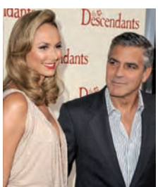
Georges Clooney et sa nouvelle compagne Stacy Keibler, lors de la promotion du film The Descendants .

L'ex-célibataire le plus convoité d'Hollywood est aussi un homme au grand cœur et il mène régulièrement des actions humanitaires en Afrique et en particulier au Soudan. ★